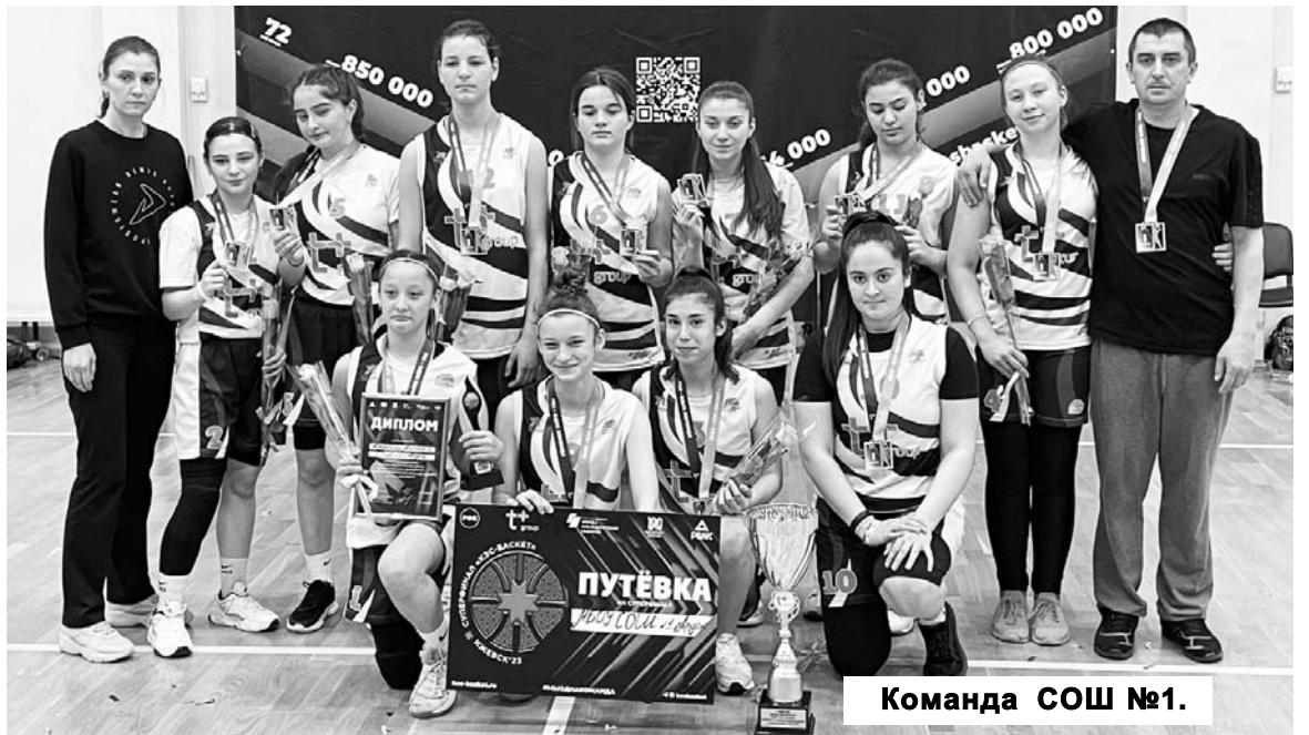
Команда СОШ №1.